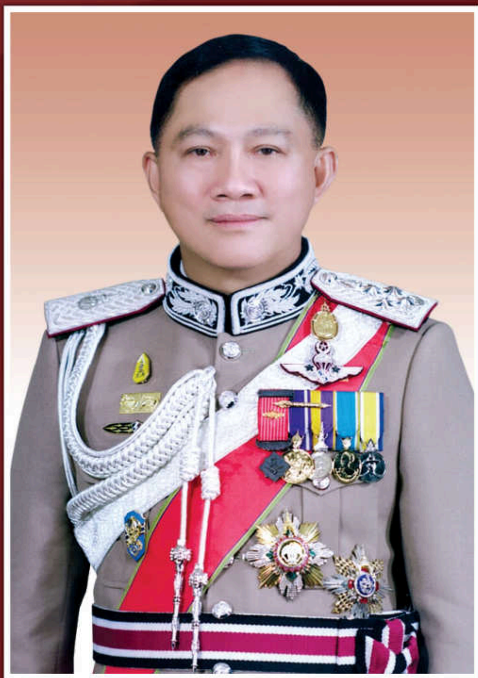
พลตำรวจเอก อุดุลย์ แสงสิงแก้ว ผู้บัญชาการตำรวจแห่งชาติ